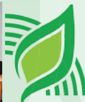
Participantes do painel de custos de produção de cana-de-açúcar em Jacarezinho/PR

O boletim Campo Futuro divulga os resultados dos estudos realizados pela Superintendência Técnica da Confederação da Agricultura e Pecuária do Brasil (CNA). Assessoria de Comunicação Social. SGAN Quadra 601 Módulo K Edifício Antônio Ernesto de Salvo CEP: 70830-903 - Brasília/DF Fone: (61) 2109-1419