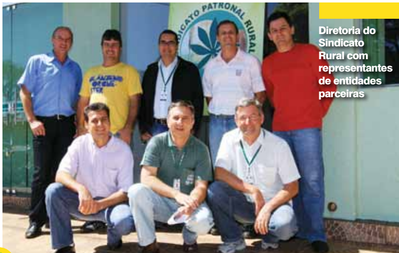
Diretoria do Sindicato Rural com representantes de entidades parceiras