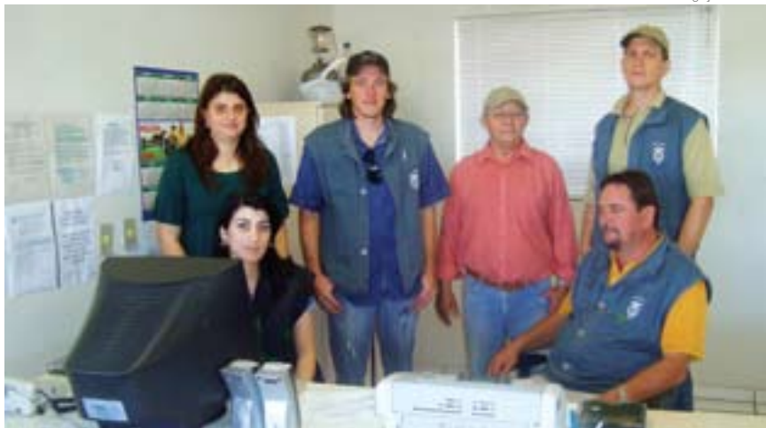
Grupo de funcionários do posto de Guaira, na fronteira com Mato Grosso do Sul e Paraguai

A mais recente aquisição do governo do Estado foram os 62 veículos, entregues no último dia 25. Os carros, modelo Ecosport, vão ser utilizados