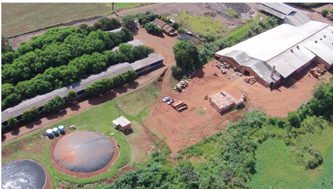
Na cerâmica Stein os tijolos dividem espaço com uma granja suína e um biodigestor que alimenta o forno da indústria

Com a modernização da agropecuária e da agroindústria, a energia passou a ser um dos principais insumos para a continuidade da produção e aumento da produtividade. Seja para resfriar frango para exportação, ou aquecer a água que limpa a sala de ordenha, esse é um recurso que tem peso cada vez maior nos custos dos produtos paranaenses e não é de hoje que vem minando nossa competitividade.