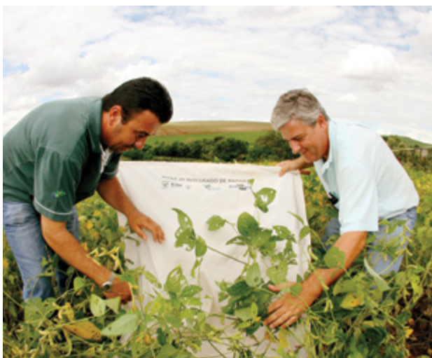
Com um pano de batida, os produtores monitoram as lavouras