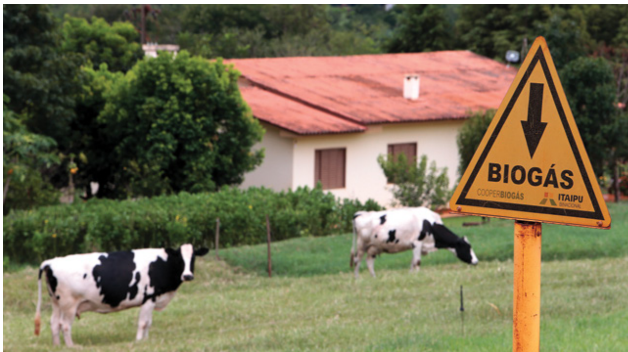
O biogás vem se tornando importante insumo na matriz energética paranaense