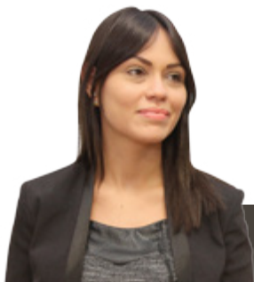
Por Tania Moreira Alberti Economista DTE/FAEP

A Companhia Nacional de Abastecimento (Conab) disponibilizará o Sistema Eletrônico de Comercialização (SEC) para as indústrias brasileiras de café realizar em leilões privados de compra de café Conilon da safra 2016/17.