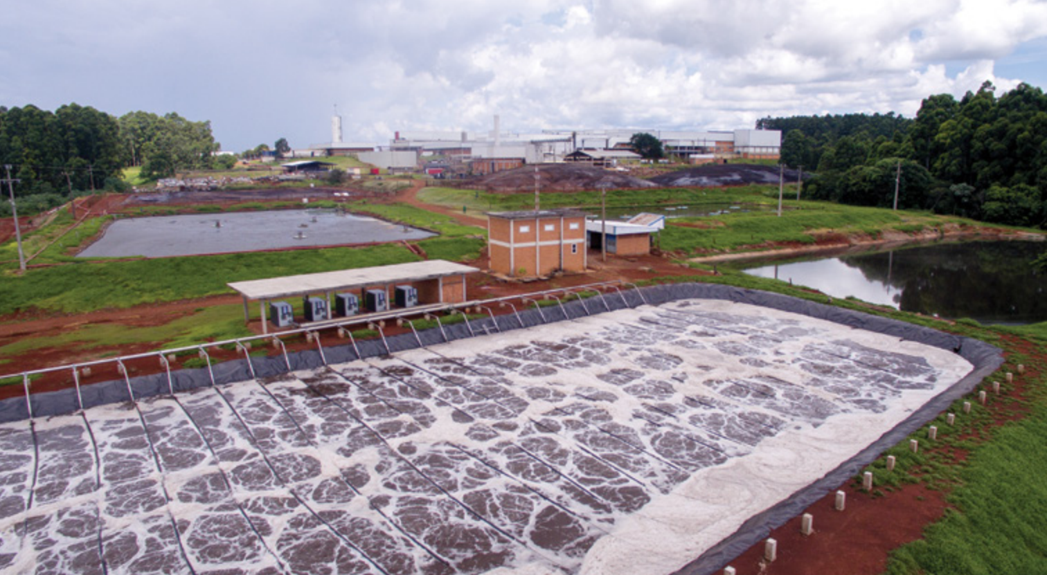
Biodigestores da unidade industrial de aves da Cooperativa LAR, em Matelândia