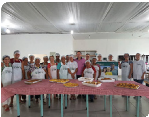
SÃO MATEUS DO SUL