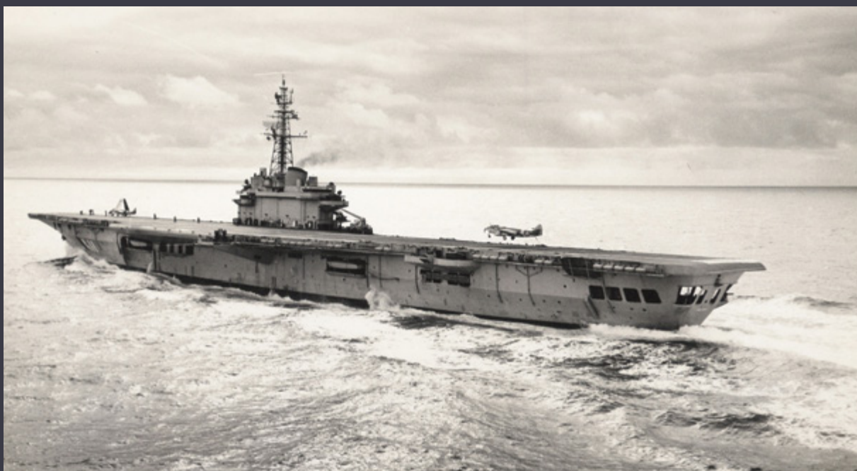
Porta-aviões Minas Gerais foi desativado em 2000 e virou sucata

O São Paulo já está no Rio de Janeiro para a desmobilização da tropa embarcada. Em junho começa o processo para realocar seus 1.920 tripulantes, que deve levar três anos. O navio deve ter o mesmo destino do seu antecessor e virar sucata.