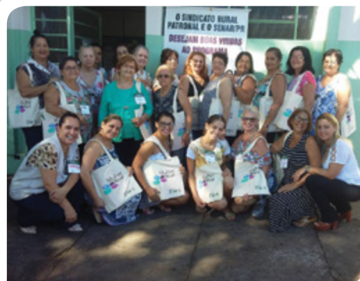
SÃO JOÃO DO CAIÚÁ

Representantes do Sindicato Rural de Pitanga estiveram presentes na edição deste ano do Produshow, feira agropecuária realizada em Pitanga, nos dias 16 e 17 de fevereiro. O estande da entidade, com 300m 2 , ofereceu ao produtor rural um local de descanso, confraternização e troca de informações.