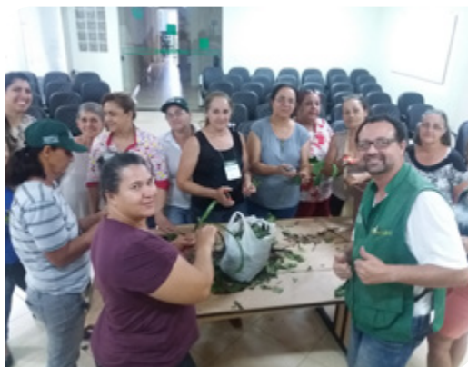
CAMPINA DA LAGOA