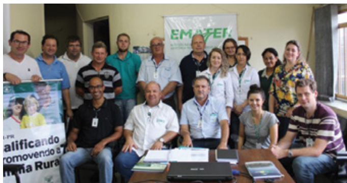
Produtores de hortifrutigranjeiros da região do Vale do Iguaçu

O projeto conta com o apoio de dez entidades, dos setores público e privado, além das associações empresariais de União da Vitória e Porto União, SENAR-PR, Emater e Secretaria Estadual de Saúde, que será responsável pelo levantamento da qualidade de água dos produtores inseridos no processo.